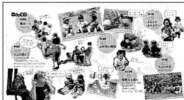
チラシの中間では、笑顔いっぱいの子どもの写真で1日の流れが紹介されています

奇心や意欲が満たされ、子どもたちがのびやかに成長します。さらに親御さんは、生き生きと遊ぶわが子の姿を見て、子どものペースに合わせた子育てを楽