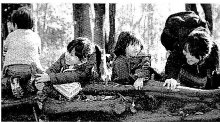
ネットやクチコミで評判が広がり、毎回10～15組ほどの親子が参加する「おひさまとことこ」

「この活動を通じて、子どもが育つ外遊びの楽しみ方を伝えていきたいです」と、意気込みを語ってくれました。